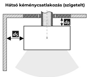
A füstcső áthaladása éghető anyagból készült falon